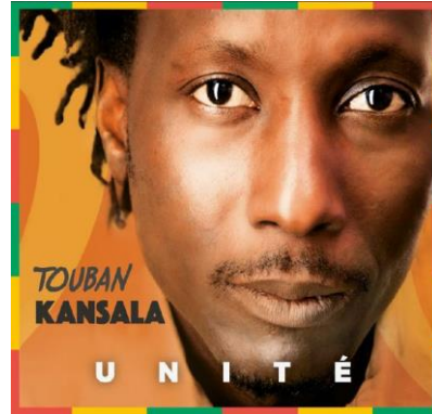
Touban Kansala – Unité (2017)