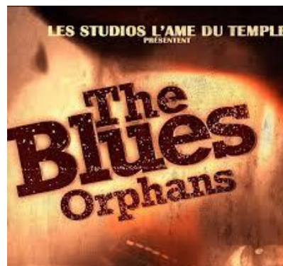
The Blues Orphans – Falling Awake (2013)