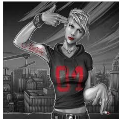
Marianne – EP (2015)