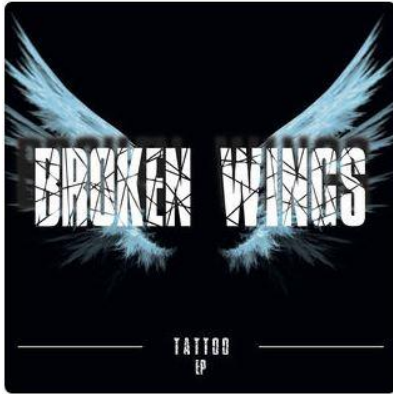
Broken Wings – Tattoo (2017)