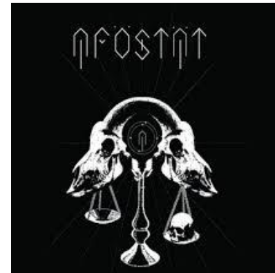
Apöstat – EP (2014)